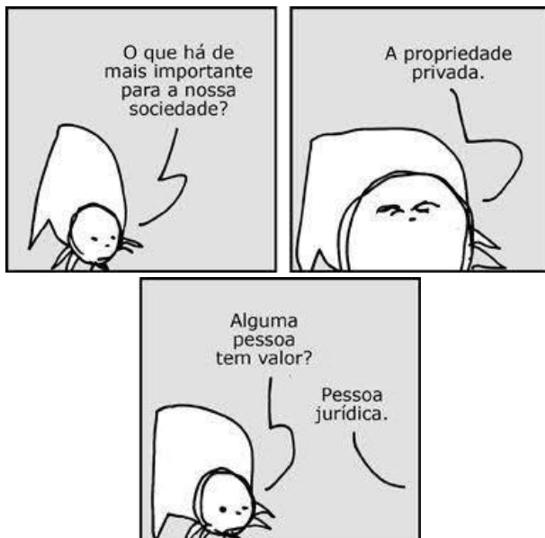
[André Dahmer, publicado na Folha de São Paulo]