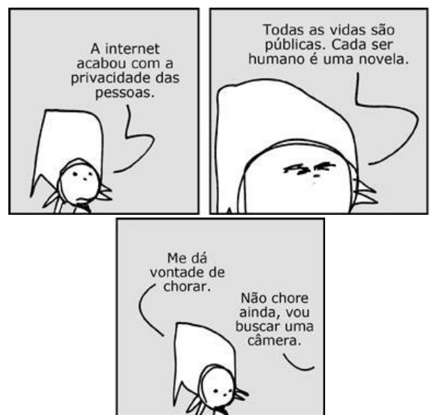
[André Dahmer, publicado na Folha de São Paulo]